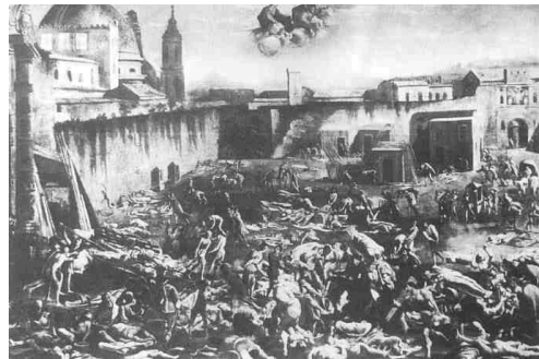
Mico Spadaro, Peste del 1656